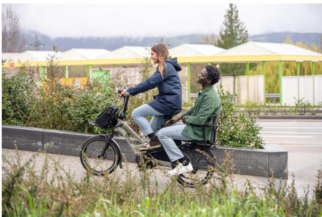
Der optimierte Atlas H Rack trägt jetzt bis zu 80 kg

Um dem hohen Gewicht gerecht zu werden, ist der HSD-Rahmen jetzt am Steuerrohr um 15% und am Tretlager um 39% steifer. Auch der Gepäckträger wurde überarbeitet: Er trägt nun bis zu 80 kg und bietet Platz für einen erwachsenen Beifahrer. All diese Verbesserungen sorgen für ein geschmeidigeres Fahrverhalten und ein besseres Handling beim Transport schwerer Lasten.