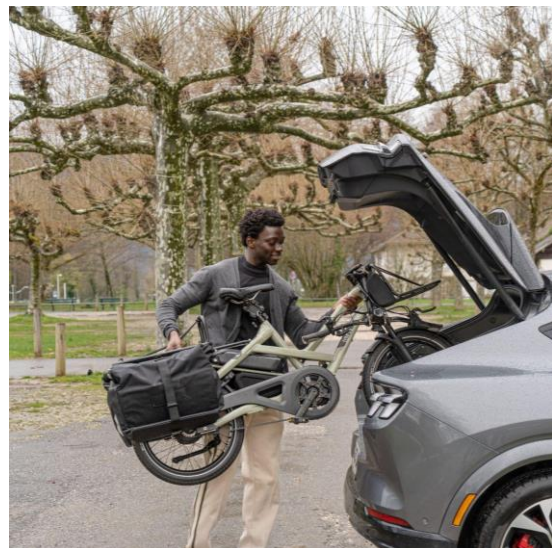
Vertikales Parken und FlatFold-Technologie erleichtern Abstellen und Transport des HSD