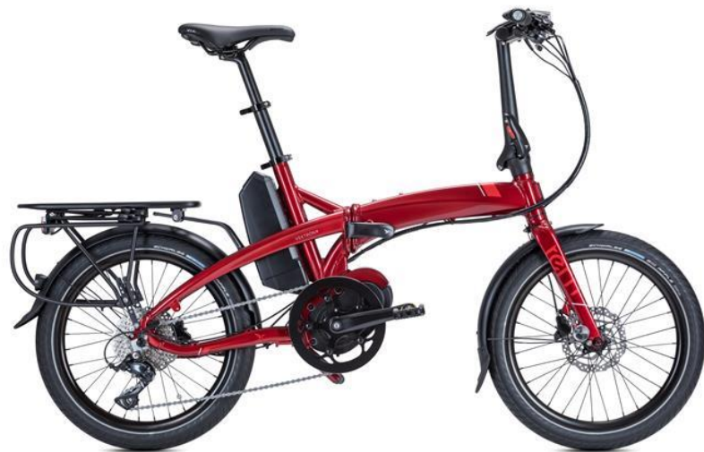
Tern Vektron P9